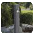
użyteczne PUNKTY POBORU WODY