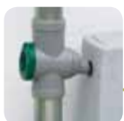
efektywne FILTRY WODY DESZCZOWEJ