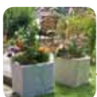
dekoracyjne DONICZKI FOSSIL