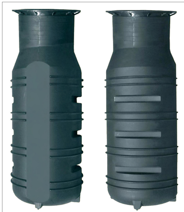
System zagospodarowania ścieków szarych GW 800-O

W skład panelu sterującego wchodzi: pompa napowietrzająca, filtr próżniowy, sterownik systemu oraz zawór napełniający. Dodatkowo system można wyposażyć w modem pozwalając na jego zdalną obsługę.