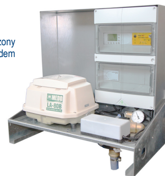
Panel sterujący wyposażony w opcjonalny modem

Ścieki po myciu i kąpieli, tzw. ścieki szare, oczyszczane są przy użyciu MBR i przechowywane w zbiorniku oczyszczonej wody w celu ich późniejszego wykorzystania do spłukiwania toalet, prania, czy też podlewania ogrodu. Jakość oczyszczonych ścieków przewyższa normy zawarte w europejskiej dyrektywie dotyczącej wody przeznaczonej do kąpieli (76/160/EEC).