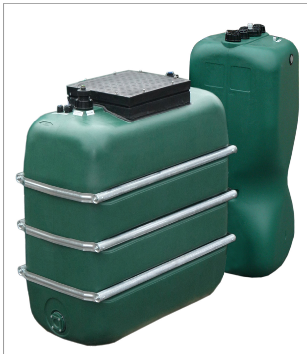
System zagospodarowania ścieków szarych GW 800-I

W skład panelu sterującego wchodzi: pompa napowietrzająca, filtr próżniowy, sterownik systemu oraz czujnik ciśnienia. Dodatkowo system można wyposażyć w modem pozwalający na jego zdalną obsługę. Panel sterujący można zamontować w pobliżu zbiorników.